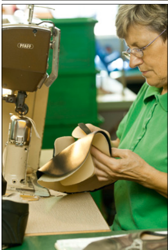
Einblicke in die Fertigung