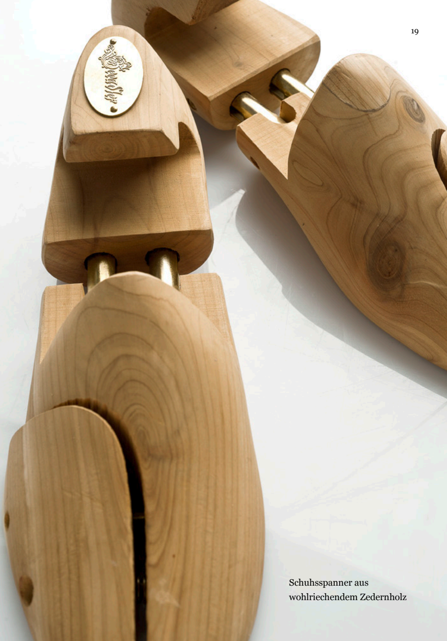
Schuhspanner aus wohlriechendem Zedernholz