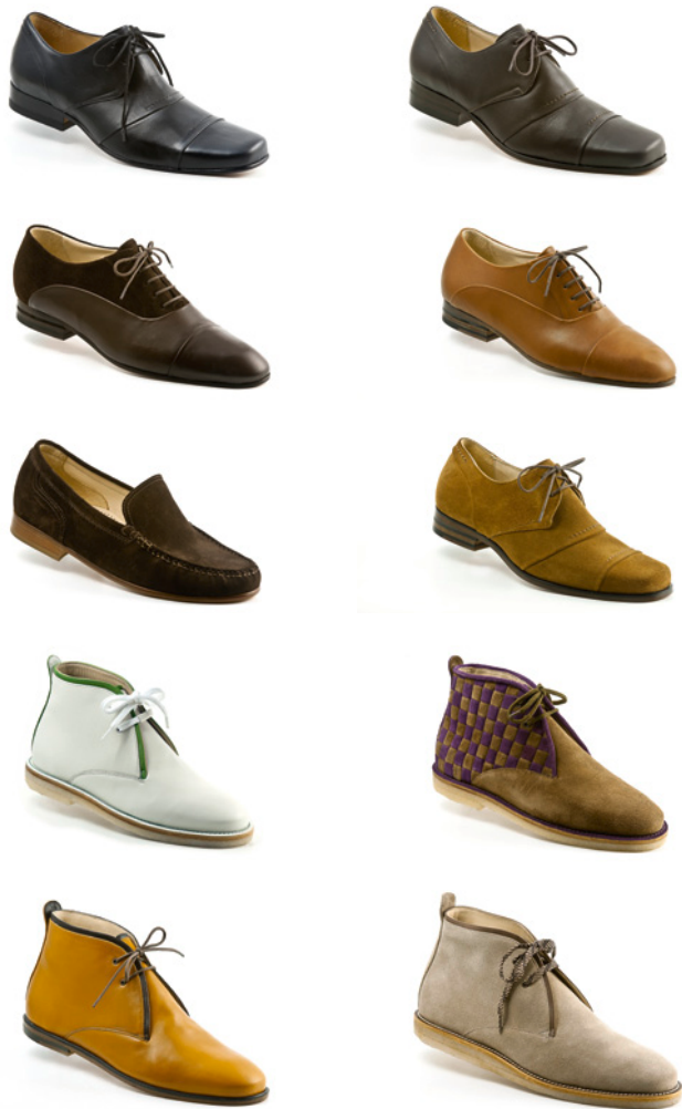
Schuhmodelle: eine Auswahl aus der Palette der Möglichkeiten